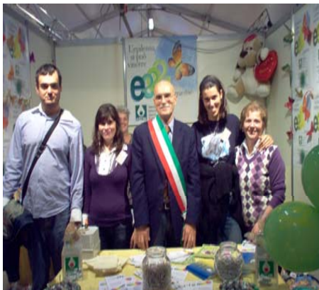
LA FOTO QUI RIPORTATA È STATA SCATTATA IN OCCASIONE DELLA DISTRIBUZIONE DEL NOSTRO MATERIALE INFORMATIVO IN OCCASIONE DELLA FIERA DI SAN LUCA A PONTERA AD OTTOBRE 2008.